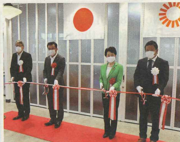
開店時のテープカット