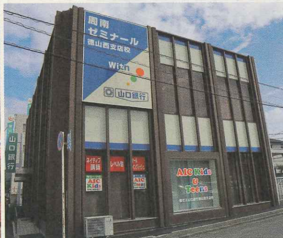
徳山西支店の外観