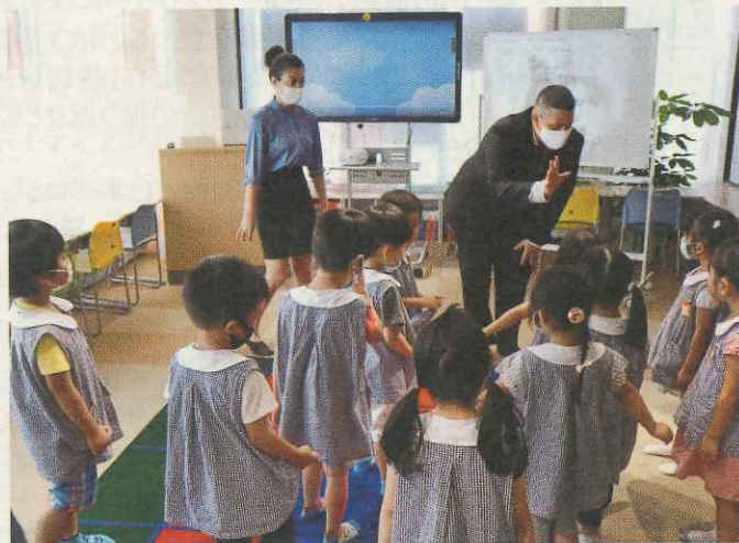
園児に話しかける英会話講師